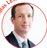
Porteur du projet et Doyen de la Faculté de santé à l'Université d'Angers

« Il faut sortir d'une vision centralisée et universitariser notre territoire »