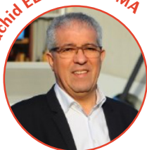
Président de la Comue Angers-Le Mans

« Ce projet illustre pleinement la capacité de notre Comue à accélérer, étendre et pérenniser les synergies existantes entre les acteurs du territoire en Recherche, Formation et Innovation »